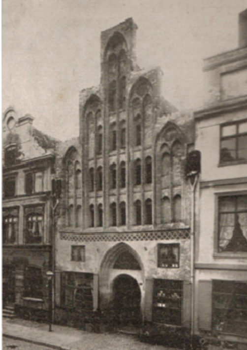
Gotisches Giebelhaus Altwismarstr. Nr. 13, abgebrochen 1889

alten Verbindungen wieder an. Als Beweis für das Wiederaufleben des Handels und des Verkehrs mögen dienen, daß den Wismarschen Hafen im Jahre 1926 bereits wieder 455 Fahrzeuge anliefen, davon 206 Dampfer und 249 Motor-, Segelschiffe und Seeleichter mit einem Gesamtrauminhalt von 178.227 Netto cbm.