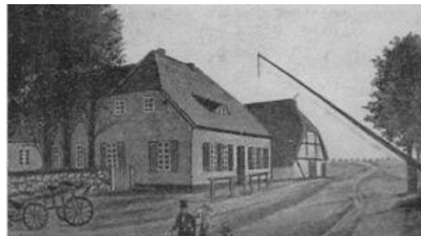
Die Lübsche Burg 1842

Während des Mittelalters mag die Stadt 8000 Einwohner gezählt haben. Die erste Zählung kurz vor dem Übergange an Mecklenburg ergab mit Einschluß des Weichbildes nicht ganz 6500, 1830 zählte man 10.000, 1900 20.000, jetzt [1927] etwa 25.700 Einwohner. Dabei ist zu beachten, daß infolge der Einführung der Amtsordnung und Landgemeindeordnung der obrigkeitliche Bezirk der Stadt ganz wesentlich eingeschränkt ist, indem erhebliche Teile jetzt zum mecklenburgischen Amt Wismar gehören, die früher Teile des obrigkeitlichen Stadtbezirks Wismar waren.